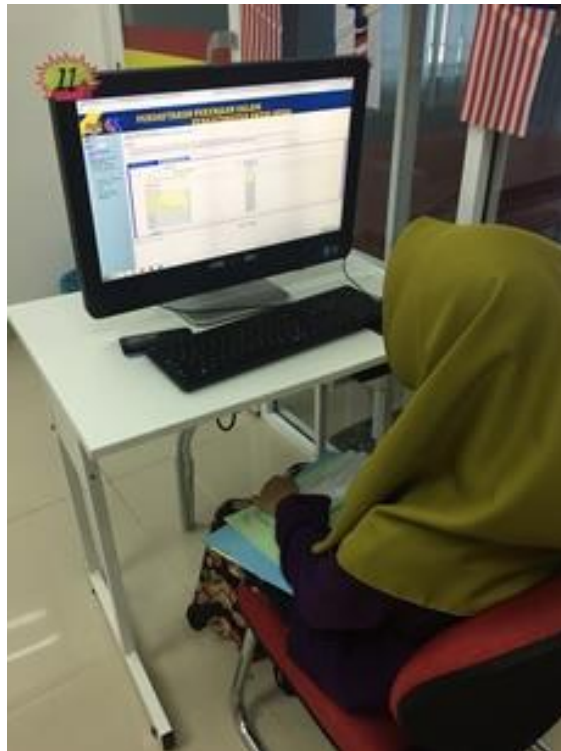
Pengisian secara online SPA