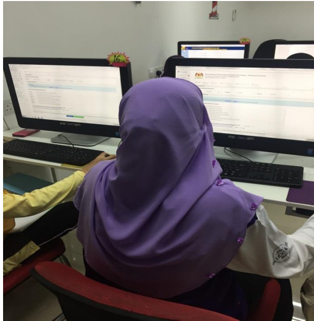
Pengisian secara online UPU