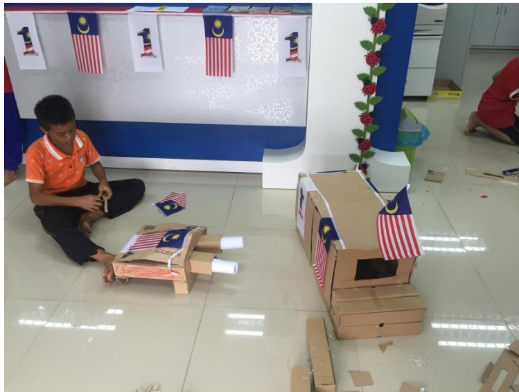
Peserta bertungkus lumus menyiapkan hasil ciptaan mereka