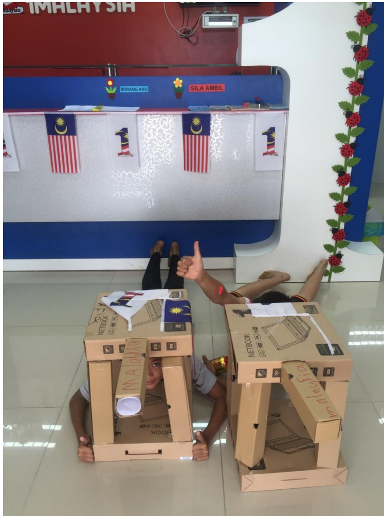
Peserta bersama hasil ciptaan mereka