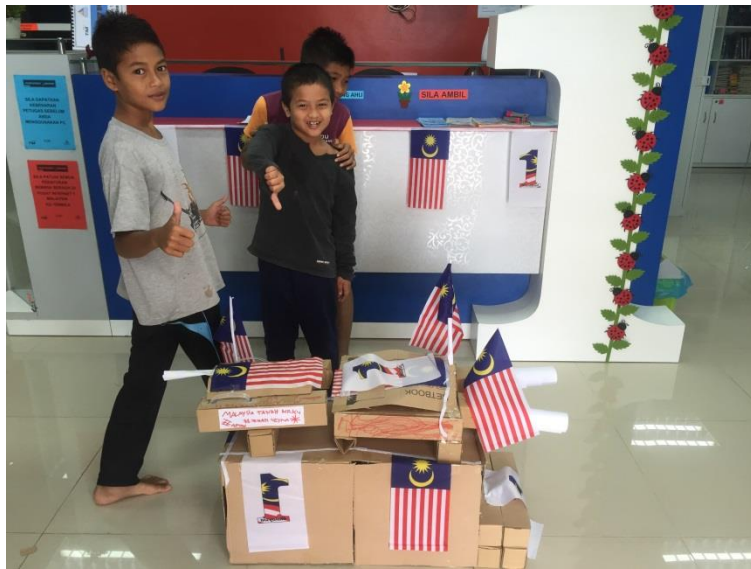
Peserta bersama hasil ciptaan mereka